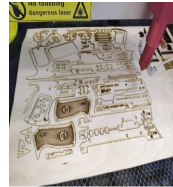
Конструкторы из фанеры