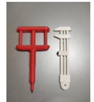
Набор кинематических инструментов