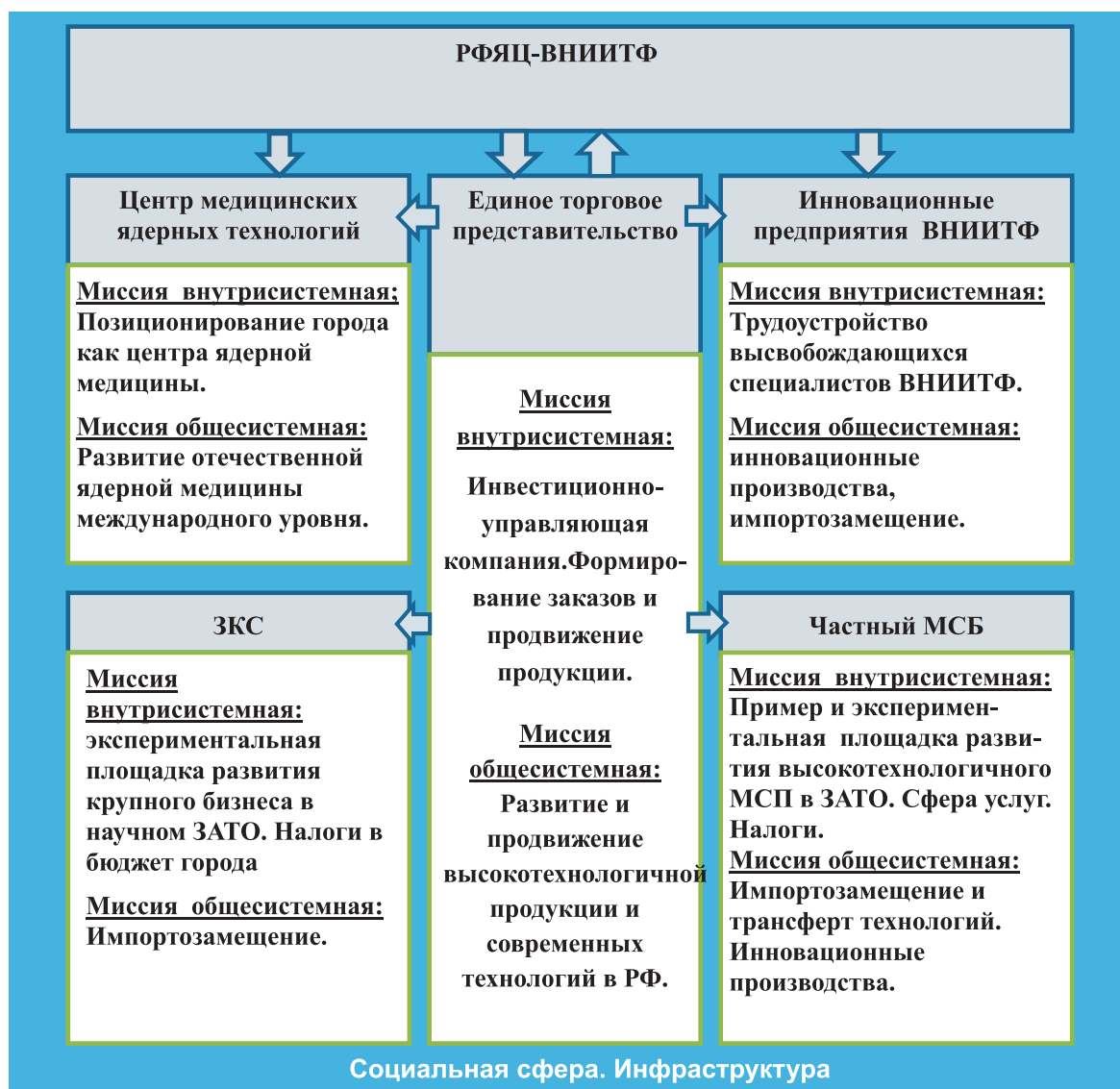
Рис. 2. Синдикативная система коэволюционного развития ВНИИТФ и гражданского сектора экономики ЗАТО Снежинск.